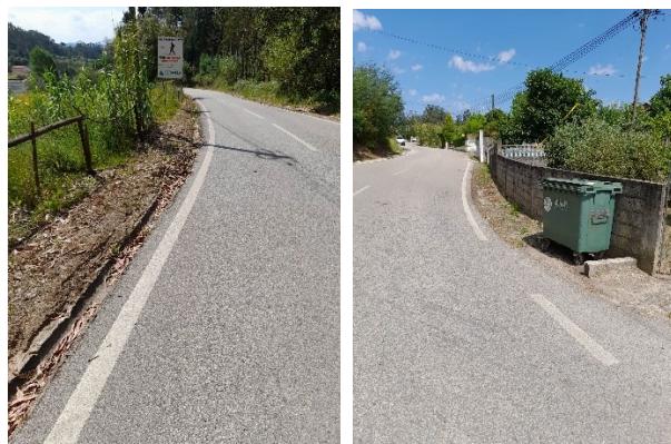
Rua Quinta da Zombaria / Estrada Monte Belo