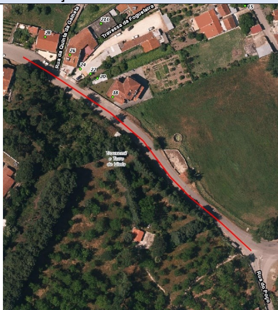
Rua da Rigueira – Fornos