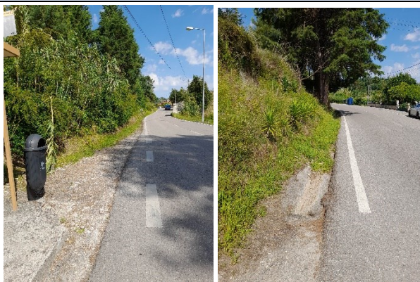
Rua da Rigueira – Fornos

Em Alcarraques, na Rua Quinta da Zombaria / Estrada Monte Belo a intervenção será no troço compreendido entre o entroncamento com a Rua do Lameiro e a Rua de Coimbra. As valetas apresentam-se em terra, irregulares e sem o correto encaminhamento das águas pluviais, devido à inexistência de sistema de drenagem de águas que permita o seu encaminhamento de forma eficiente.