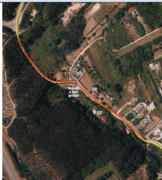
Rua Quinta da Zombaria / Estrada Monte Belo - Alcarraques